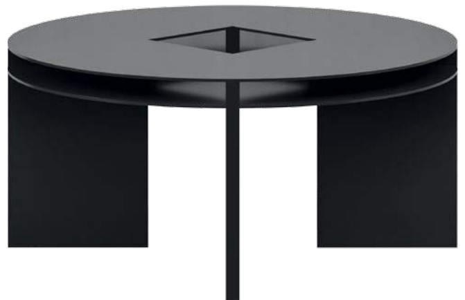
● Compact laminate (10mm), waxed / Kompaktplatte (10mm), gewachst

DONALD DISCUSSION ist ein Tisch für Arbeit, Besprechung und Ab- oder Auslage. Im Bezug und als Verweis auf Donald Judd verbindet sich im Produkt minimales Design und hochwertiges Material, serielle Produktion und flexible Funktion. Als 'Round Table', kann ohne Hierarchie nicht nur im Büro, sondern auch in der Küche am DONALD DISCUSSION zusammengekommen werden. Die kreisförmige Arbeitsfläche, die bereits in Judd's Referenz integrierte Dopplung als Ablage sowie die abnehmbaren Tischbeine bieten Effizienz in Form, Funktion und Logistik.